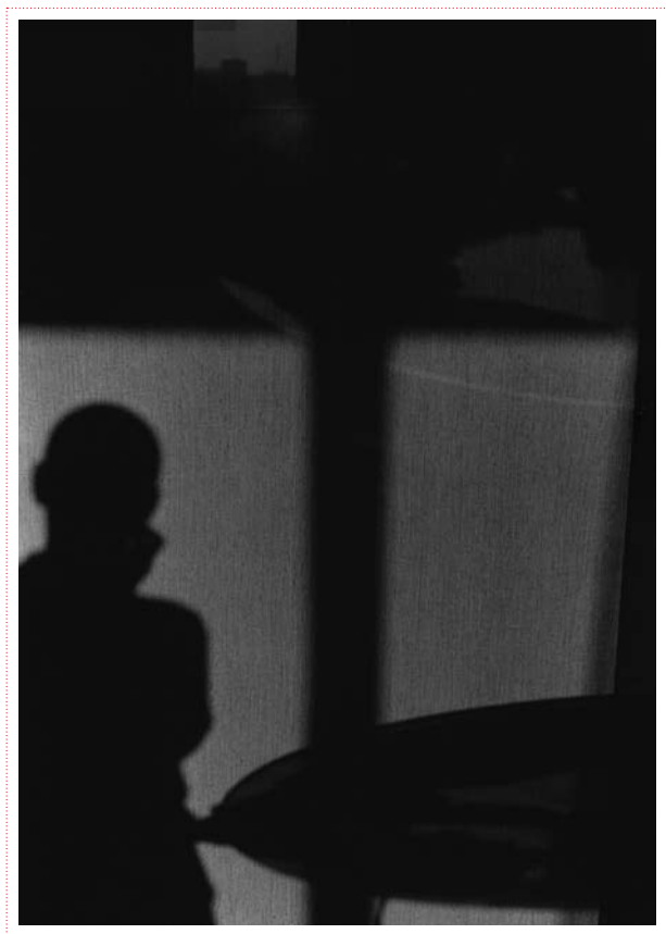
Jean-Jacques Louvigny «Sans titre»