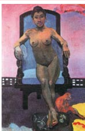
Paul Gauguin «Aita tamari vahine judith te prari»