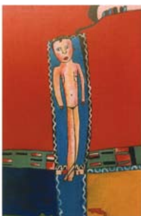
Jacques Charlier «Sans titre»

Oeuvres réalisées au cours du projet «Autour de la marge» dans le cadre de Bruges 2002, capitale européenne de la culture