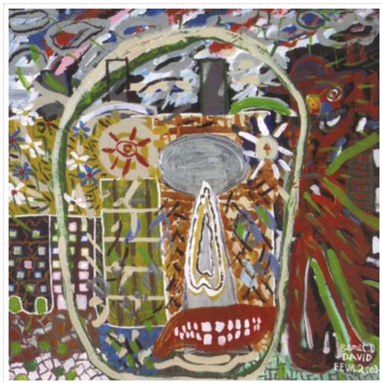
David Benet «Sans titre» 2003, Collection Art en Marge