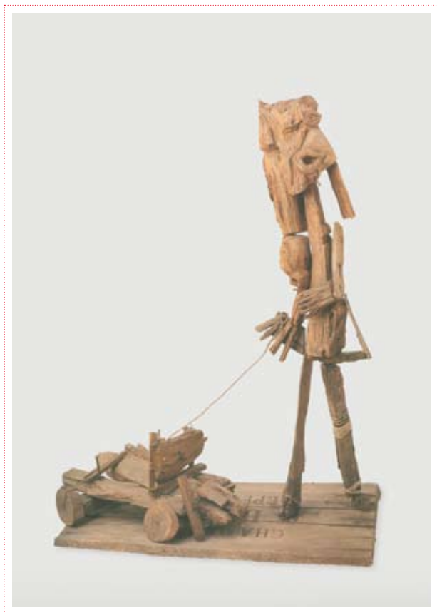
Célestin Pierret «Charette» Collection Art en Marge