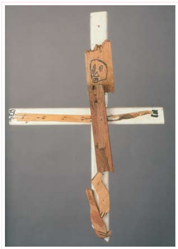
Jean-Pol Godard « Sans titre » Collection Art en Marge