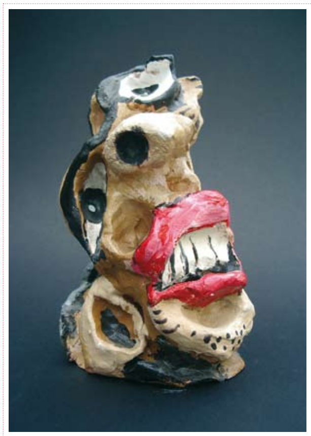
Jeannine Lejeune «Tête» Collection privée