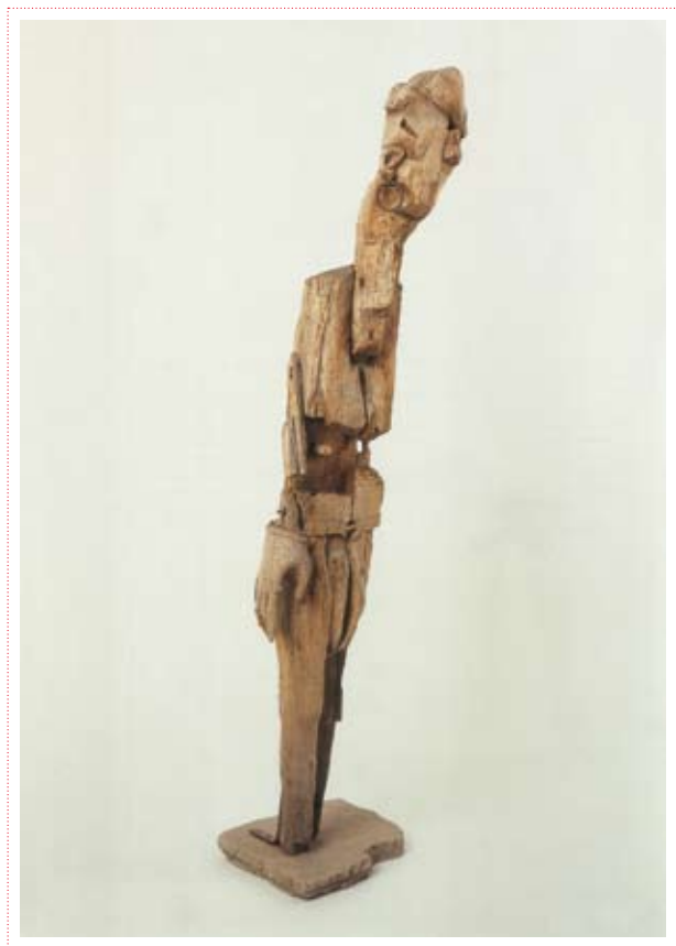
Célestin Pierret « Figure debout à la boucle d'oreille » Collection Art en Marge