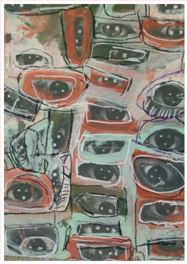
Anny Servais « Sans titre » 2007, ©Créahm Liège