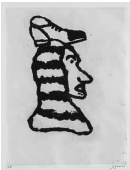
Antonio Segui Como un Sombrero , 2008 49 x 37,5 cm / 19,2 x 14,7 in. gravure au carborundum sur papier Japon contrecollé sur Arches.