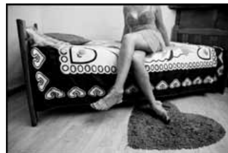
Une prostituée dans une chambre à Charleroi.