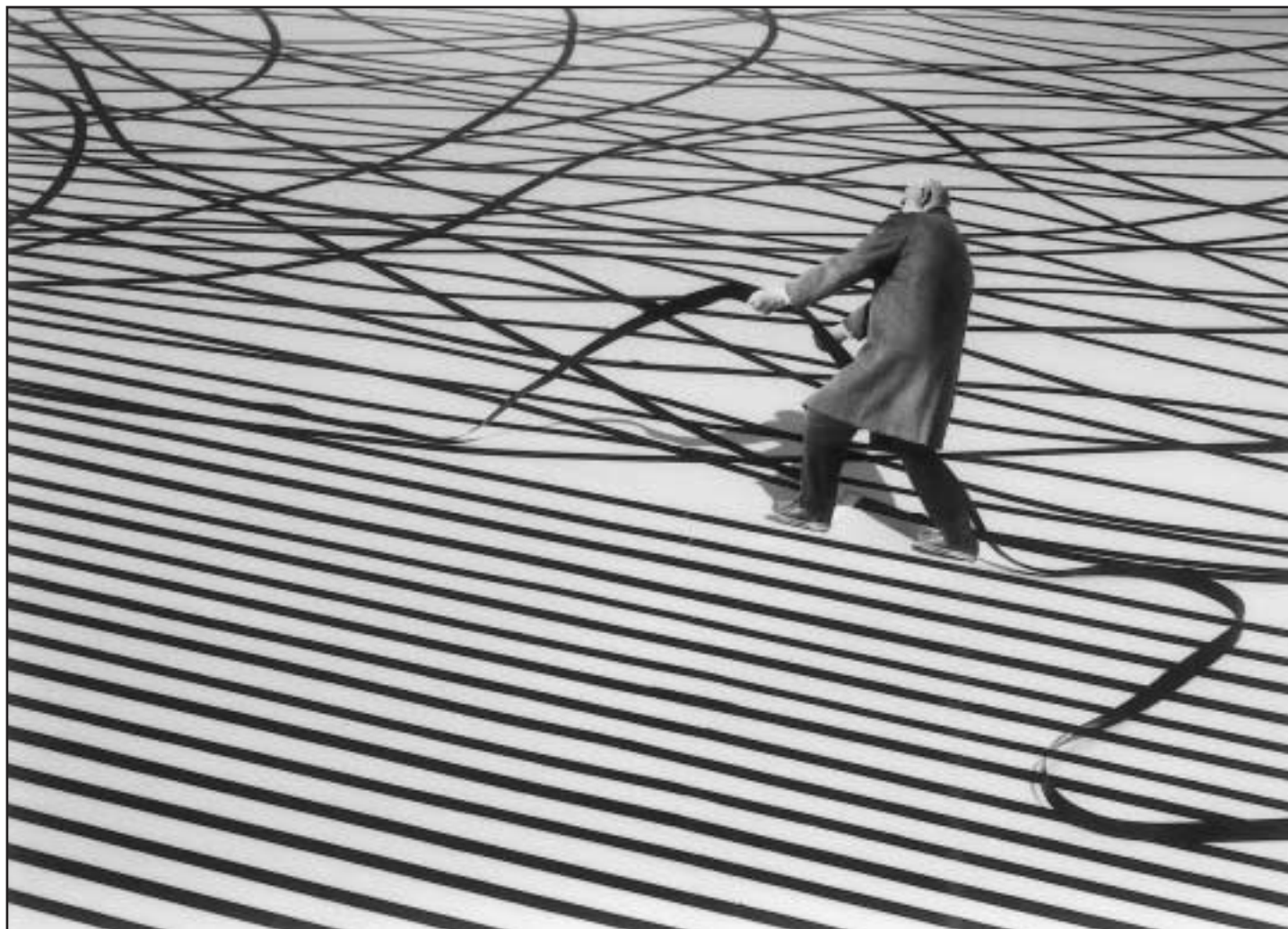
Gilbert Garcin, Changer le monde

Trois ans déjà avant l'inauguration du musée, des activités se mettent en place en ce sens, afin de sensibiliser les habitants à un projet pour le moins surprenant dans une région fragilisée économiquement. Les enfants, avec leur curiosité, sont un relais indispensable en cette matière (33% de la population de cette région étant touchée par le chômage, seul l'enfant scolarisé "a des horaires" et une ouverture sur le monde autre que familiale). Une équipe se