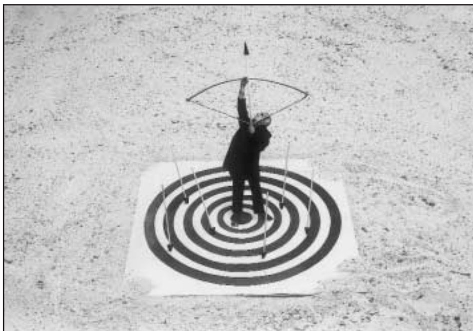
Gilbert Garcin, Le cœur de la cible