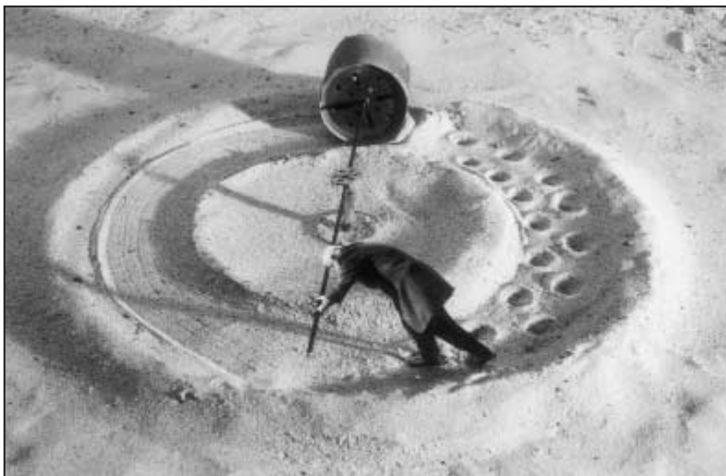
Gilbert Garcin, Le moulin de l'oubli

Info: 02 538 15 12 isabelle@lezarts-urbains.be www.lezarts-urbains.be