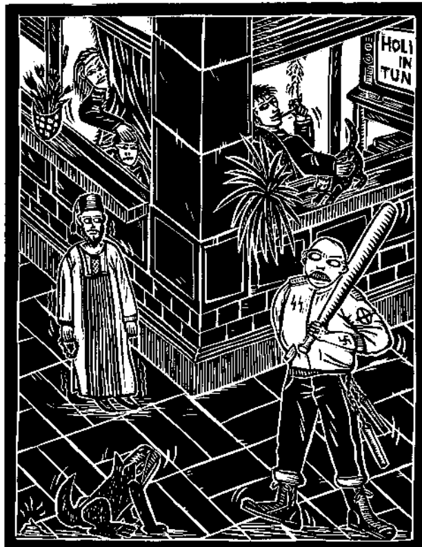
Thierry Lenoir, Coin de rue n° 2, bois , 1991