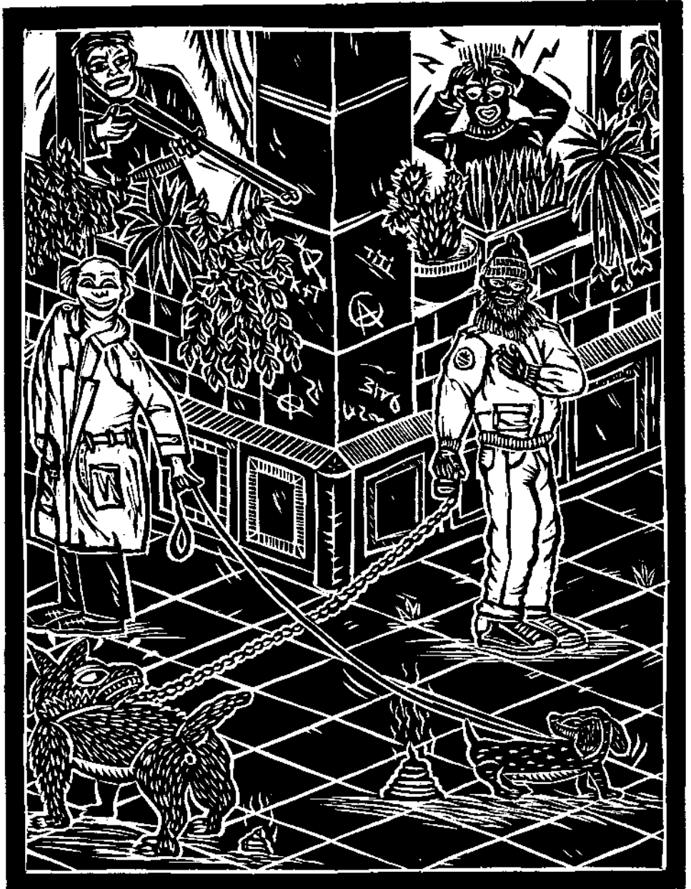
Thierry Lenoir, Coin de rue n° 4, bois, 1991