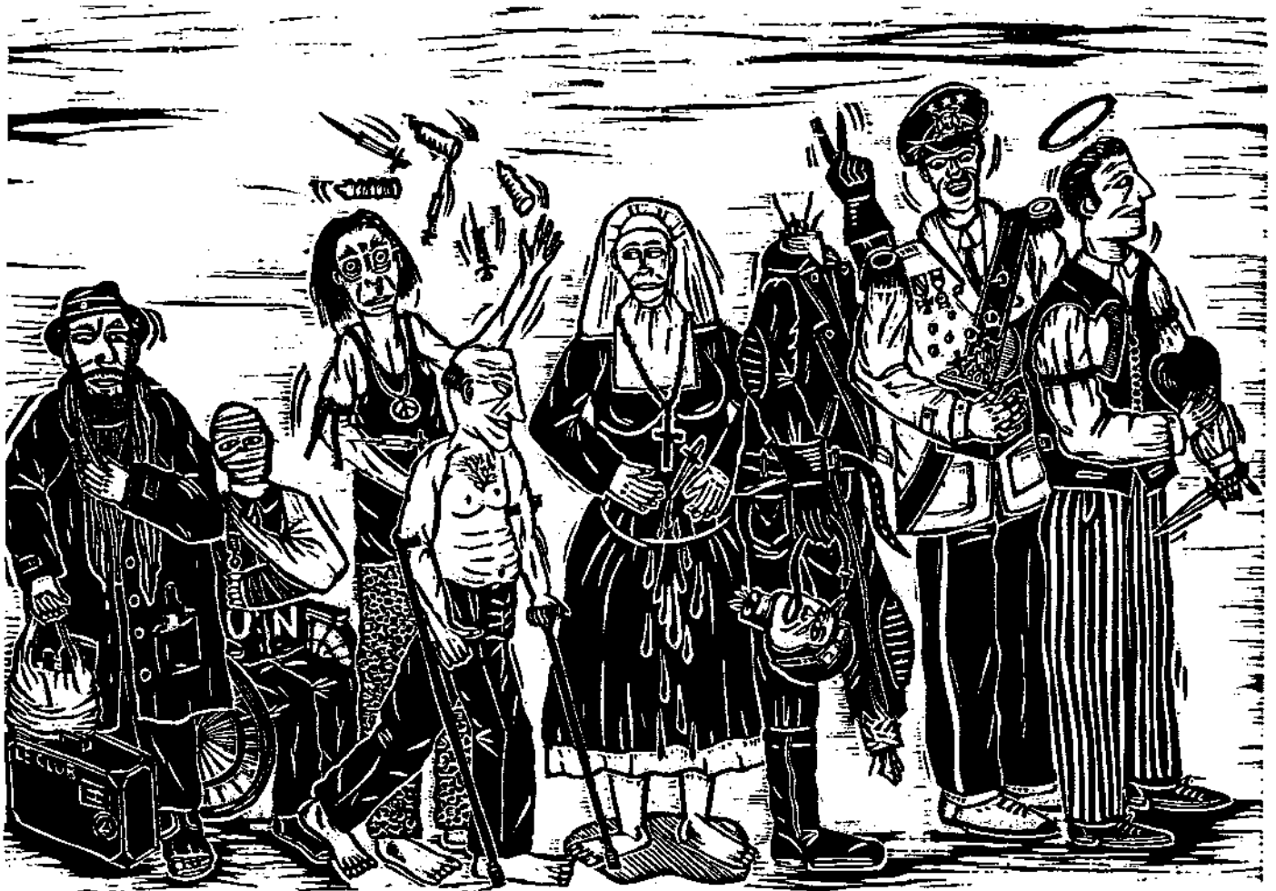
Thierry Lenoir, A la queue! (au paradis), bois, 1998