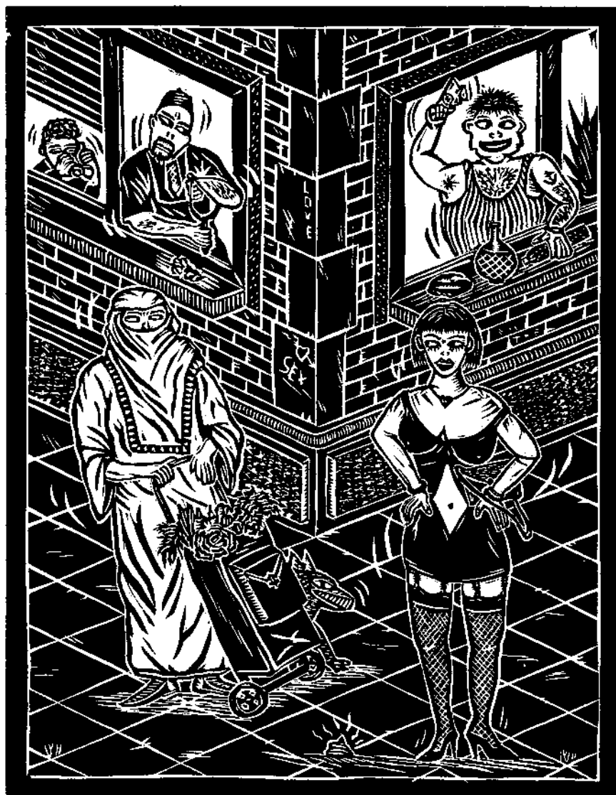
Thierry Lenoir, Coin de rue n° 3, bois, 1991

Il reste beaucoup de questions autour de ces projets, en matière de reconnaissance, de formation, de financement, d'information, de coordination, de médiation, de développement, de récurrence. Une réelle volonté de la part des responsables politiques est indispensable afin de dégager les moyens adéquats au développement de ces initiatives encore confidentielles et ponctuelles.