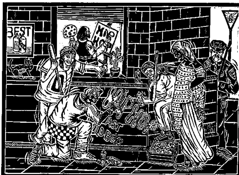
Thierry Lenoir, Les bergers d'Arcadie , d'après Poussin, bois, 1998

Dans ce sens, Made in Belgium est un échec: le projet accumule les clichés derrière une scénographie attractive. Mais que va réellement retirer le grand public de cet événement? Il va retenir quelques noms jusque-là inconnus, sans pour autant les inscrire dans une continuité... La mise en scène supplante aujourd'hui l'objet, le document, alors que le seul moyen de rendre une exposition didactique et populaire est de partir d'une démarche scientifique, suivie de l'élaboration d'une scénographie adéquate (qui succède et non précède la sélection de la pièce) et, finalement, d'un travail de médiation, qui reste la meilleure interface entre l'œuvre et le public. Ce principe, évident, vaut la peine d'être rappelé, car plus que jamais, l'informatif et la "fait-diversification" l'emportent sur l'explicatif, la communication ayant d'ailleurs tendance à devenir hégémonique, en culture comme en politique.