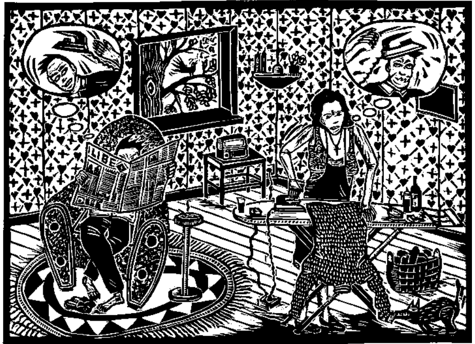
Thierry Lenoir, C'est l'amour (repassage) , bois, 1989

Le dialogue, selon eux, doit nécessairement être intégré à une activité: conférence, séminaire, ou événement médiatisé. Parler à l'autre, cela se fait au Parlement, ou aux Nations-Unies. Il me semble, au contraire, que - et j'insiste là-dessus - le