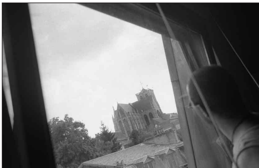
Quartier Ste Marguerite, Liège