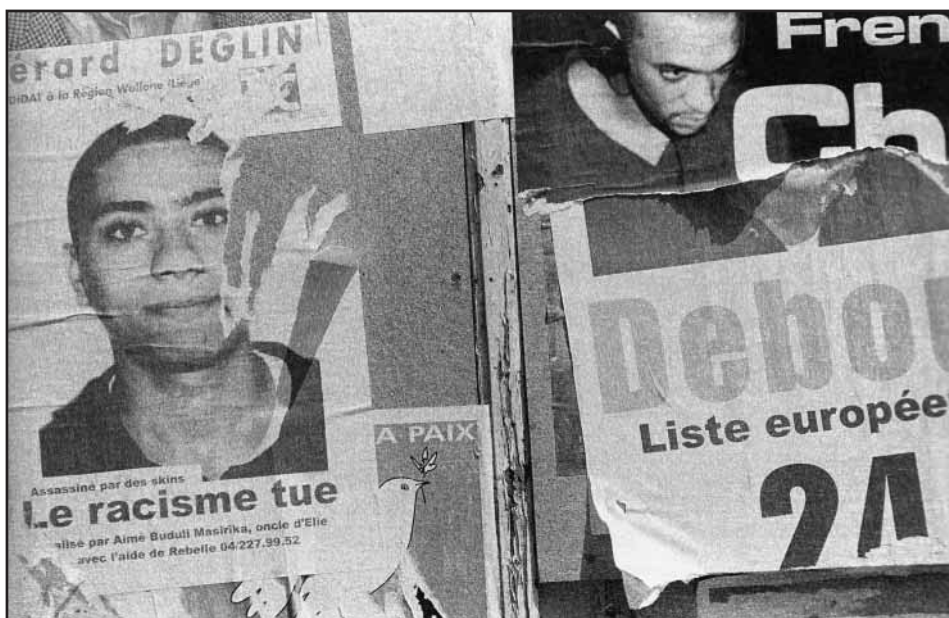
Quartier Ste Marguerite, Liège

Trente ans plus tard, la situation a considérablement empiré. Et il est peu probable que le 50e anniversaire de la télévision permette de s'interroger à ce propos. Dommage pour la télévision publique et la démocratie et même pour une certaine idée de la modernité.