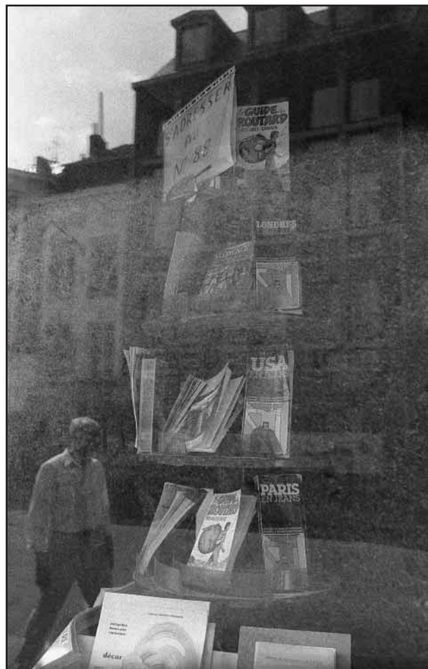
Quartier Ste Marguerite, Liège