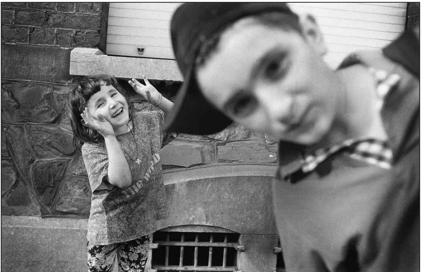
Quartier Ste Marguerite, Liège