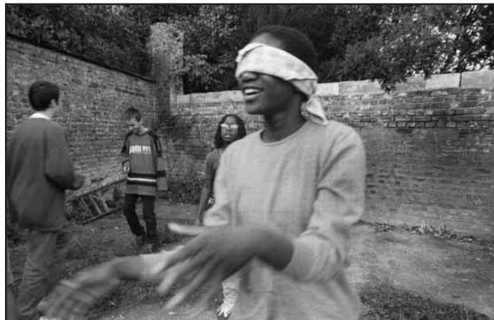
Quartier Ste Marguerite, Liège