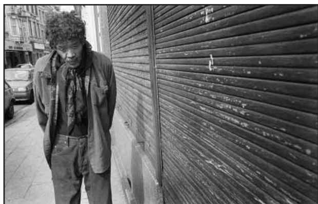
Quartier Ste Marguerite, Liège