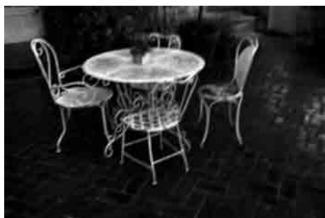
Troubles – © Anne-Sophie Costenoble / CARAVANE