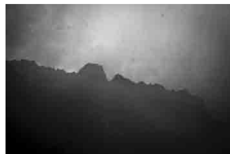
Troubles – © Anne-Sophie Costenoble / CARAVANE