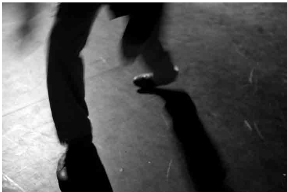
La Bad Ass Cie

éclaire la raison et le sensible, d'autre part ce qui tire vers le bas et obscurcit l'âme. Et c'est exactement ce qui nécessite une politique culturelle publique dont le but est d'organiser les échanges entre ces deux faces de la culture à l'avantage de celle tournée vers l'énergie de progrès. C'est ce travail qui semble abandonné ou n'être plus que l'ombre de lui-même – si pas dans les faits, de plus en plus dans les discours et les savoirs théoriques –, le succès du consumérisme ayant mis tout le monde d'accord par le fait même qu'il occupe tout l'espace conscient et inconscient. Aujourd'hui, le temps disponible dont les cerveaux disposent pour, à partir de biens culturels, produire de la subjectivité et investir dans un partage du sensible responsable, est majoritairement occupé par des produits de distraction dont la propagation populaire fascine toutes les instances décisionnelles reposant sur l'électoralisme, l'audimat, le profit rapide et facile. Et ces évolutions sont naturalisées tant la révolution conservatrice avec ses bras armés du management et du marketing a sournoisement infiltré les savoir-faire quotidiens, les gestions, les règles de bonne gouvernance, les automatismes, même les nôtres . Au stade avancé de la société du spectacle, il ne suffit pas d'accuser tel ou tel décideur de favoriser «la suprématie progressive du spectaculaire». Cette suprématie s'installe aussi en passant par nos actes,