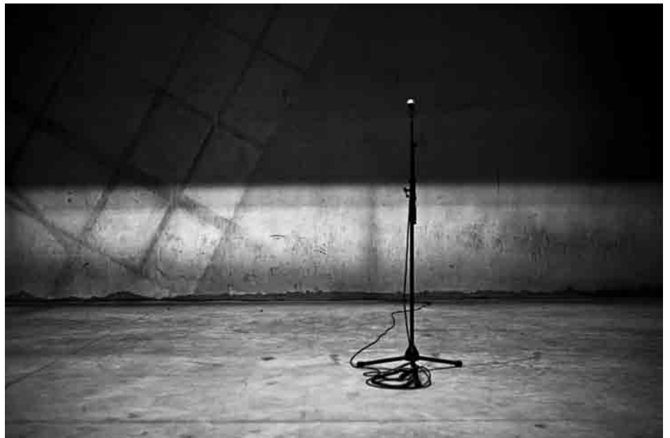
La Bad Ass Cie

Où pouvons-nous collectivement nous approprier cette dimension symbolique: partager une langue, une mémoire et un imaginaire? Nous initier aux mystères de la vie et des origines? Aux ruses de l'amour et à l'angoisse de la mort? Où pouvons-nous interroger la morale et questionner nos valeurs communes? Esquisser un rapport critique à l'Histoire et aux structures sociales? Dessiner l'ébauche d'une cosmogonie?